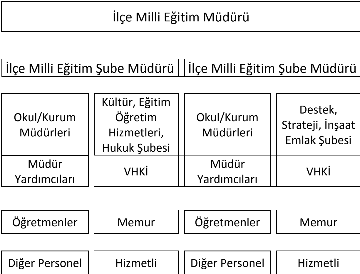
Tablo 6: İle Mem Organizasyon Őeması